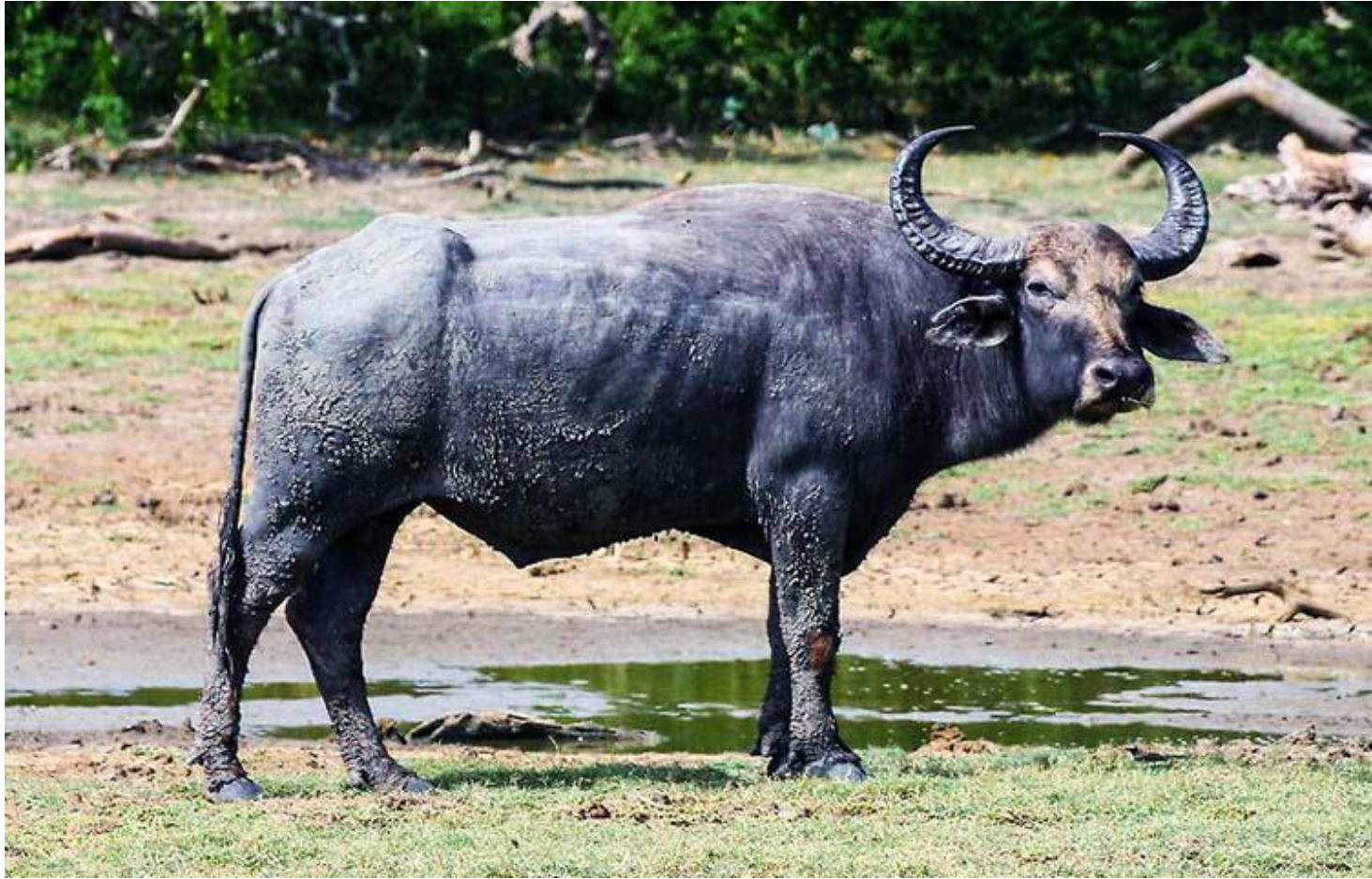
BÚFALO DE AGUA